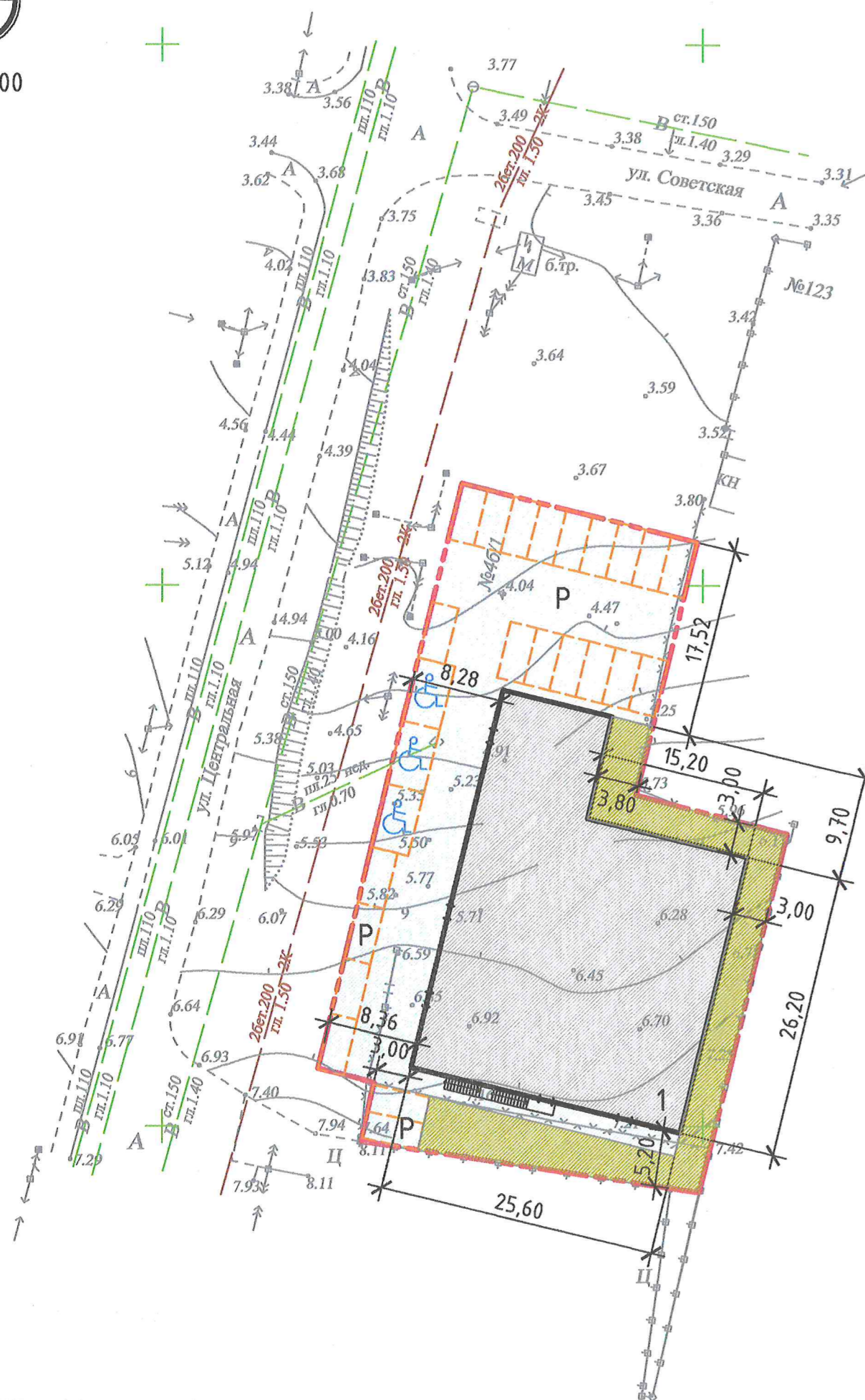
СХЕМА ПЛАНИРОВОЧНОЙ ОРГАНИЗАЦИИ ЗЕМЕЛЬНОГО УЧАСТКА