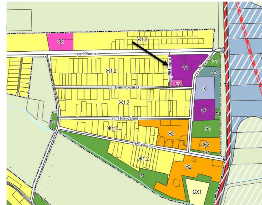
О1. Многофункциональная общественно-деловая зона