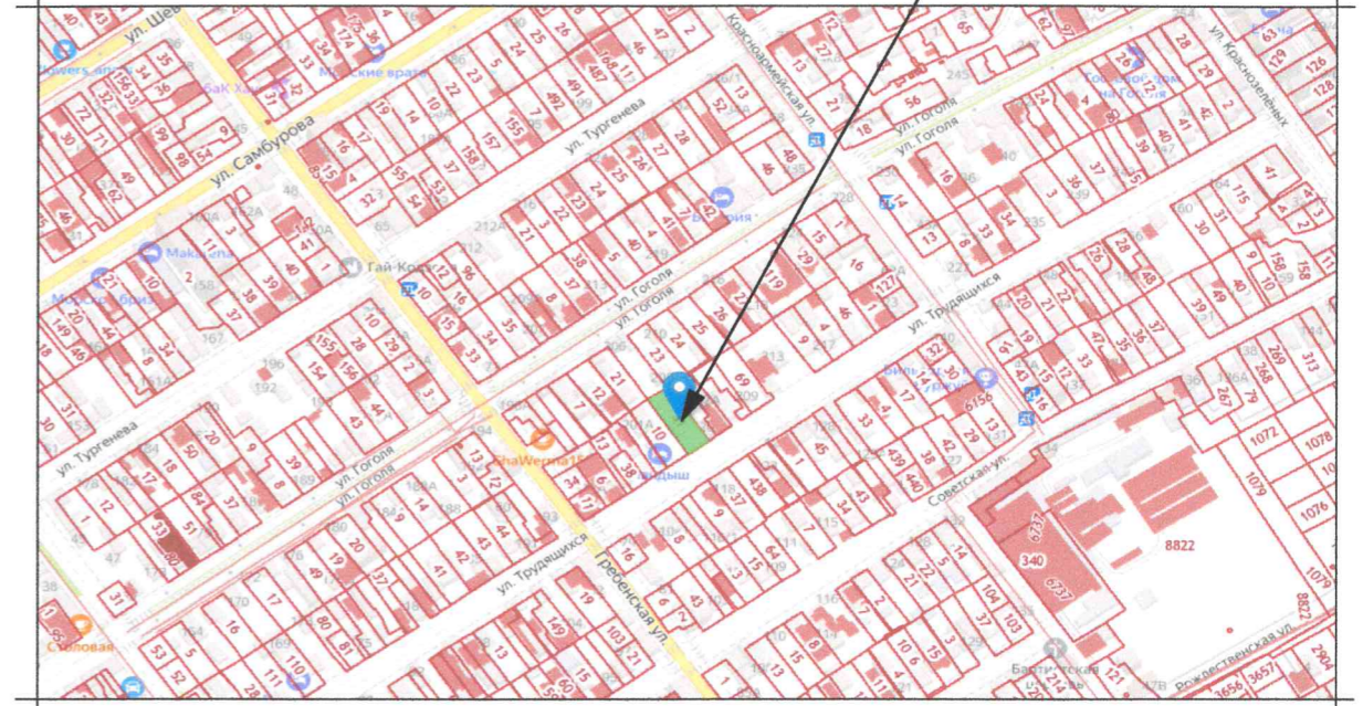
СХЕМА ПЛАНИРОВОЧНОЙ ОРГАНИЗАЦИИ ЗЕМЕЛЬНОГО УЧАСТКА. М 1:500.