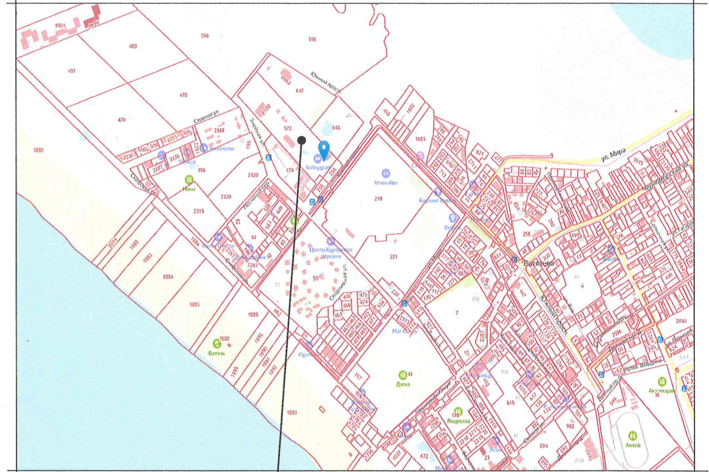
Земельный участок с кадастровым номером 23:37:0000000:73