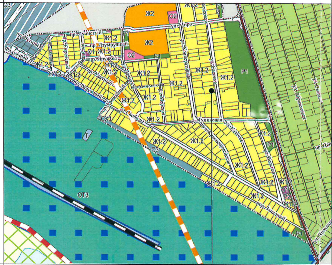
Земельный участок с кадастровым номером 23:37:0716001:286