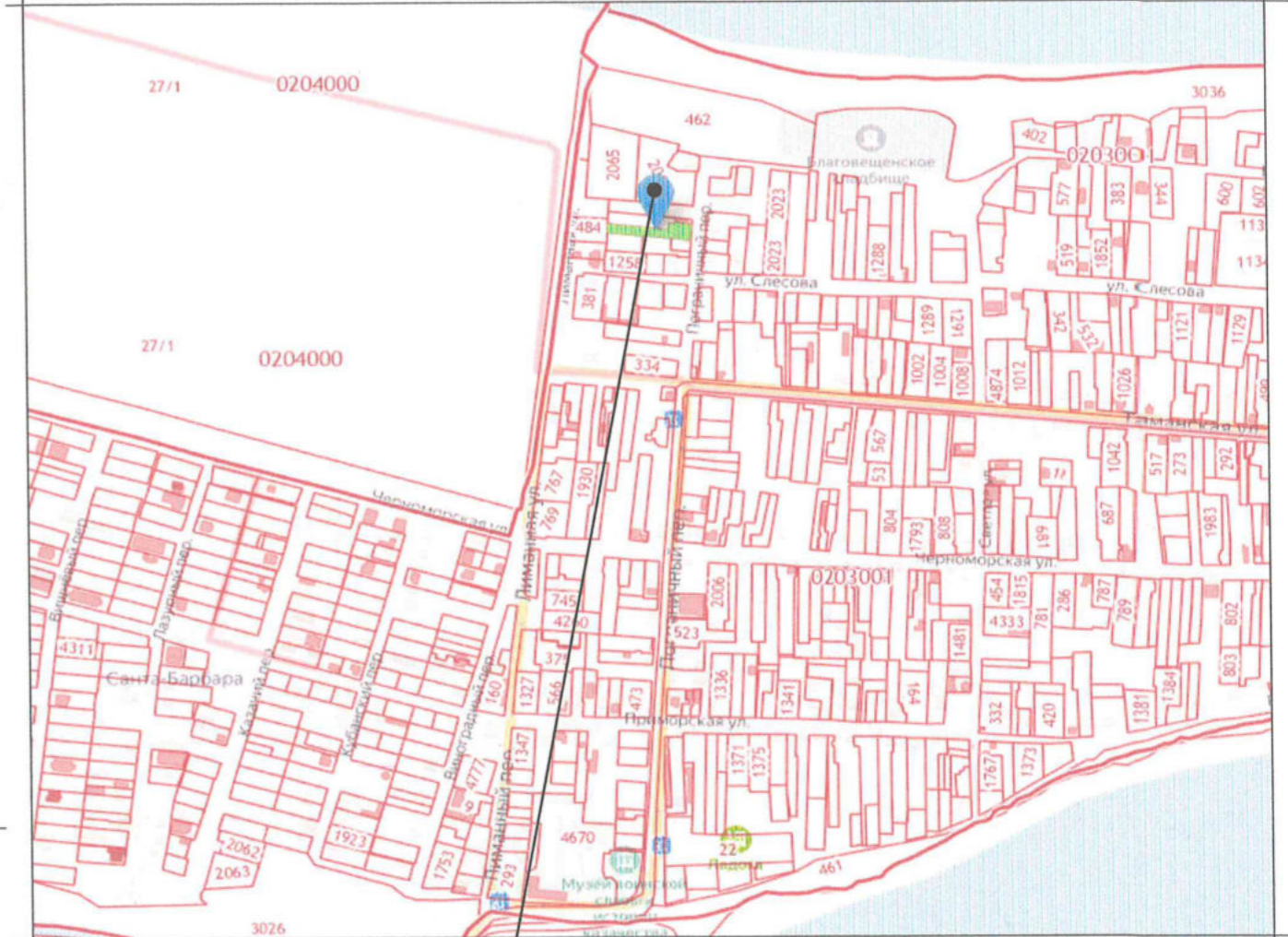
Земельный участок с кадастровым номером 23:37:0203001:335