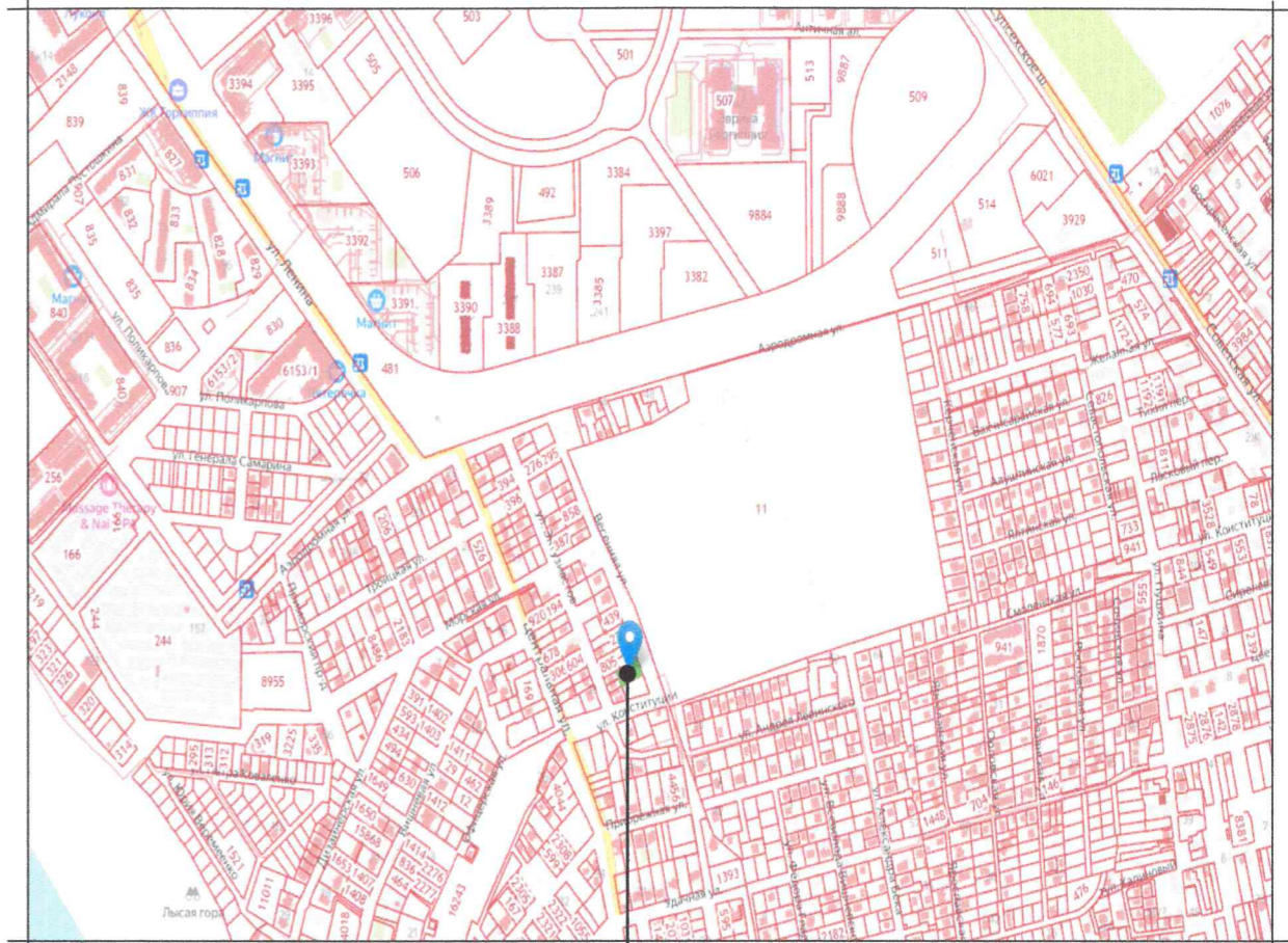
Земельный участок с кадастровым номером 23:37:1001001:1387