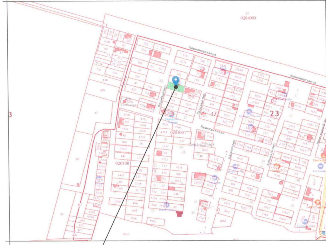
Земельный участок с кадастровым номером 23:37:0203001:1730