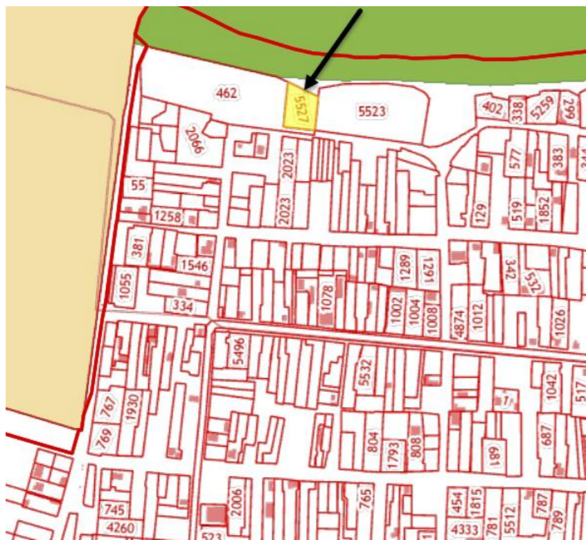
С1. Зона кладбищ

по предоставлению разрешения на условно разрешенный вид использования земельного участка, расположенного относительно ориентира: г. Анапа, с/о Благовещенский, ООО «Благовещенка» (23:37:0203001:5527)