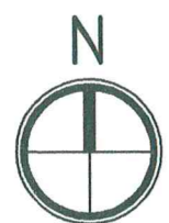
СХЕМА РАСПОЛОЖЕНИЯ ЗДАНИЯ НА ЗЕМЕЛЬНОМ УЧАСТКЕ

по предоставлению разрешения на условно разрешённый вид использования земельного участка, расположенного по адресу: по адресу: Краснодарский край, г-к.Анапа, х. Красный Курган, ул.Свободы, 55а (кад. №23:37:0709006:397)