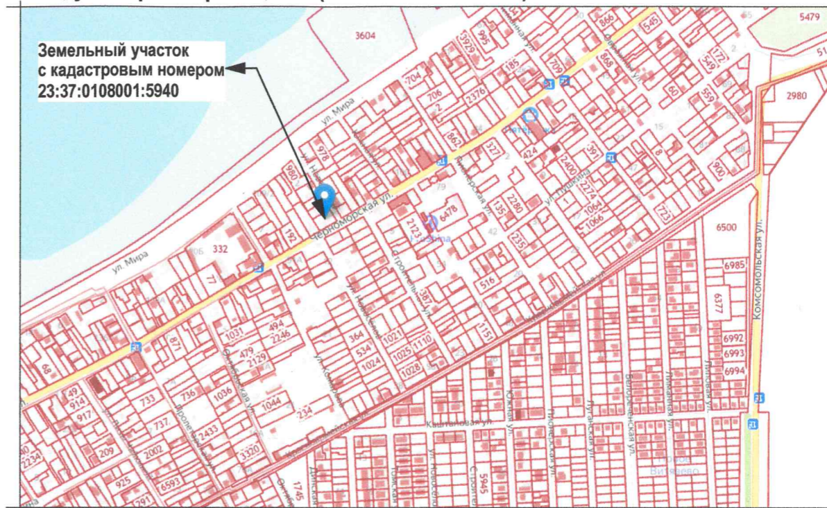
СХЕМА ПЛАНИРОВОЧНОЙ ОРГАНИЗАЦИИ ЗЕМЕЛЬНОГО УЧАСТКА. М 1:500