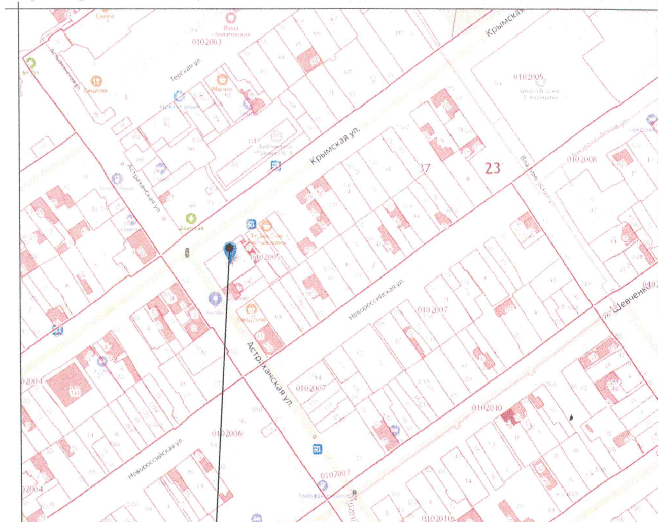
Земельный участок с кадастровым номером 23:37:0102005:371