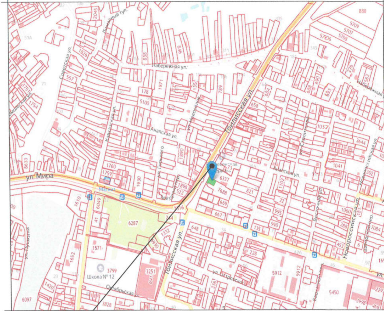
Земельный участок с кадастровым номером 23:37:0812003:7687