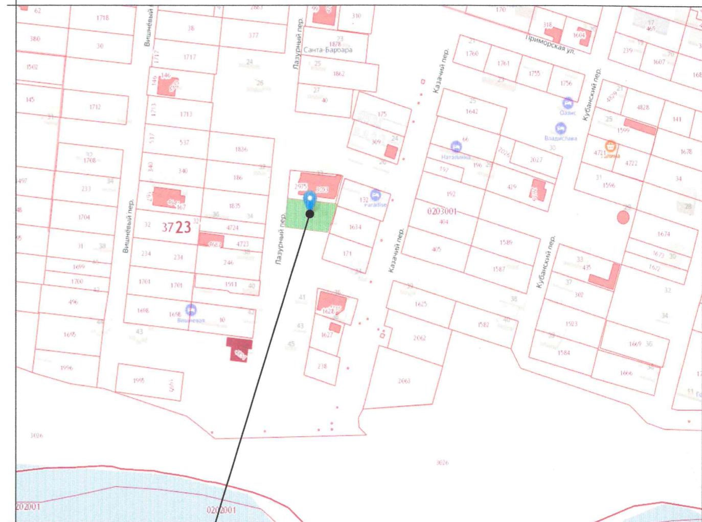
Земельный участок с кадастровым номером 23:37:0203001:2974