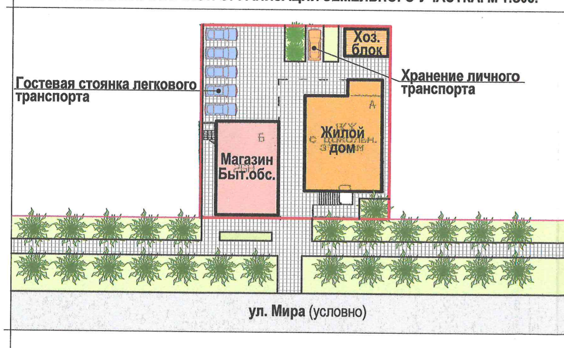
СХЕМА ПЛАНИРОВОЧНОЙ ОРГАНИЗАЦИИ ЗЕМЕЛЬНОГО УЧАСТКА. М 1:500.