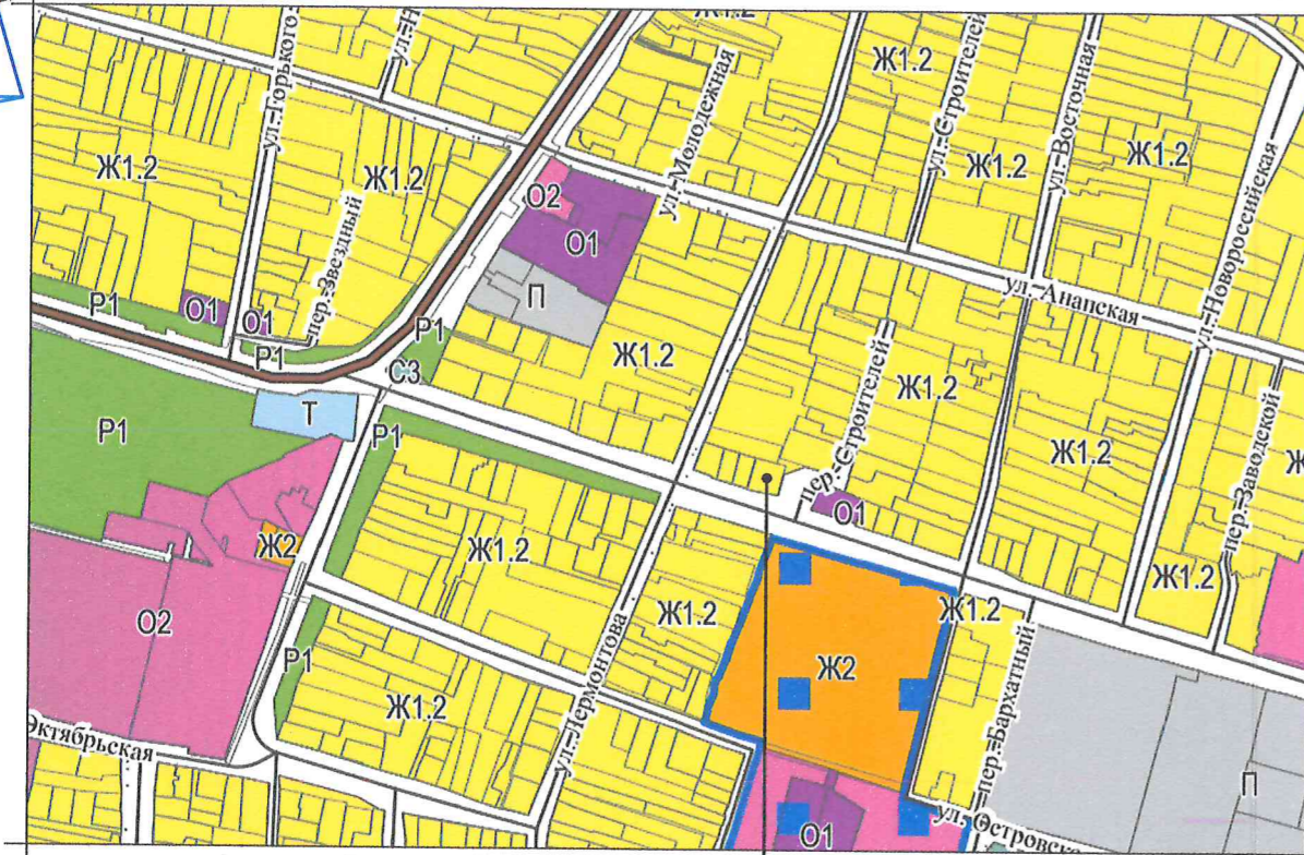
Земельный участок с кадастровым номером 23:37:0812003:278