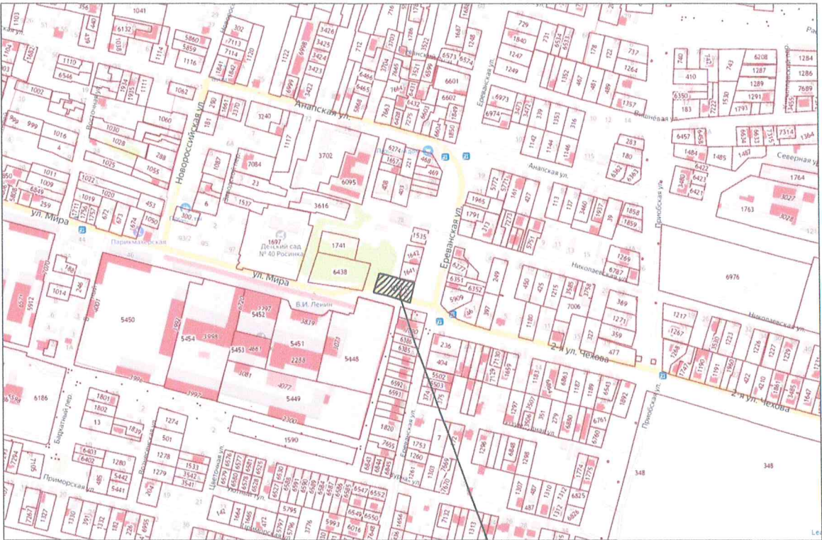
Земельный участок с кадастровым номером 23:37:0812003:3250

по предоставлению разрешения на условно разрешённый вид использования земельного участка, расположенного по адресу: Краснодарский край, Анапский район, ст-ца Анапская, ул. Ереванская, 26 (кад.№23:37:0812003:3250)