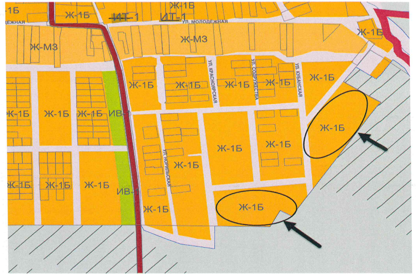
Ж-1Б Зона застройки индивидуальными жилыми домами с содержанием домашнего скота и птицы