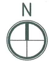
СХЕМА РАСПОЛОЖЕНИЯ ЗДАНИЯ НА ЗЕМЕЛЬНОМ УЧАСТКЕ