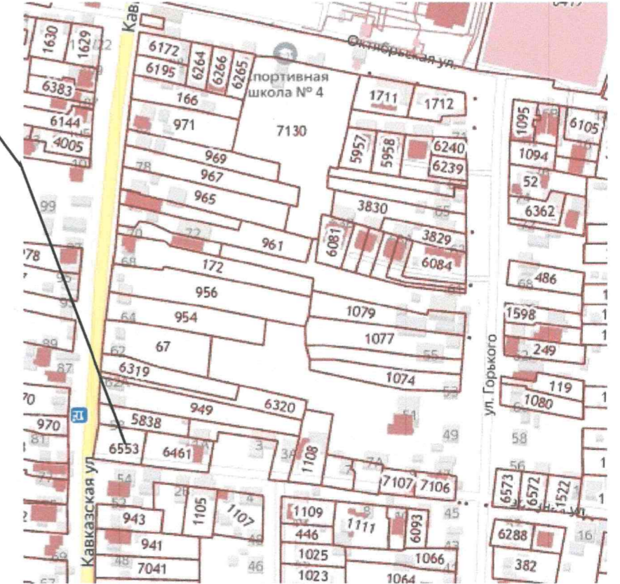
Схема планировочной организации земельного участка

земельный участок с кадастровым номером 23:37:0812002:6553