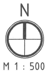
СХЕМА РАСПОЛОЖЕНИЯ ЗДАНИЯ НА ЗЕМЕЛЬНОМ УЧАСТКЕ