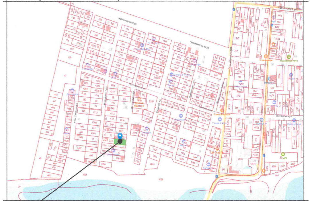
Земельный участок с кадастровым номером 23:37:0203001:246