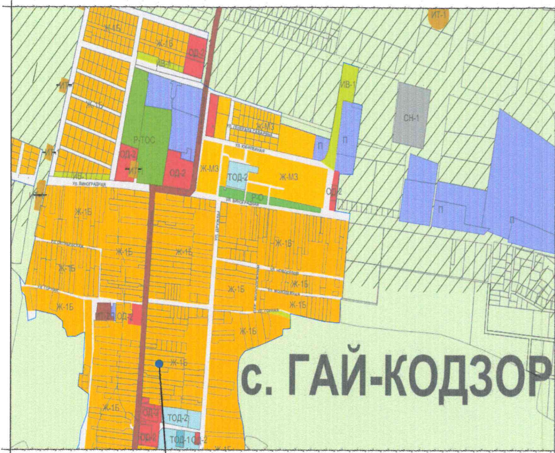
Земельный участок с кадастровым номером 23:37:0903001:161