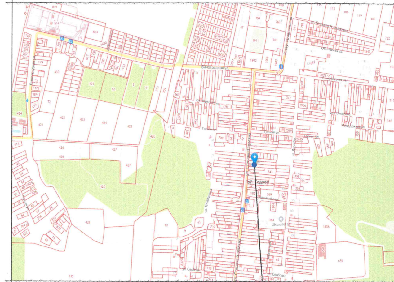
Земельный участок с кадастровым номером 23:37:0903001:161

Ж-1Б - ЗОНА ЗАСТРОЙКИ ИНДИВИДУАЛЬНЫМИ ЖИЛЫМИ ДОМАМИ С СОДЕРЖАНИЕМ ДОМАШНЕГО СКОТА И ПТИЦЫ