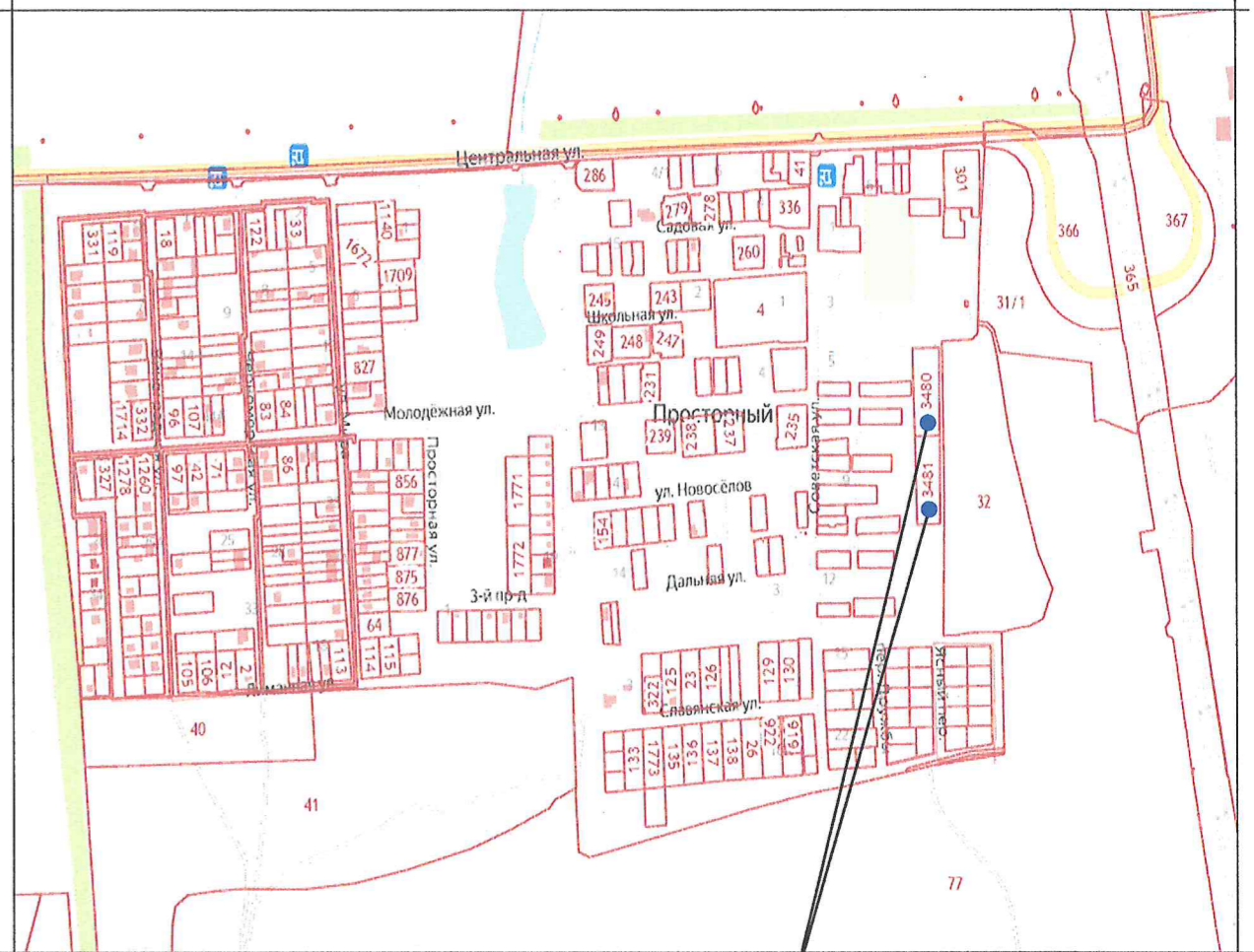
Земельный участок с кадастровым номером 23:37:0000000:3480, 23:37:0000000:3481