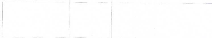
Схема границы эксплуатационной ответственности

Организация водопроводно-канализационного хозяйства